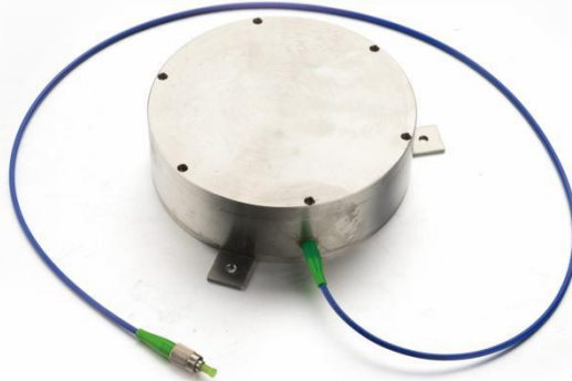
图1.2.2: ZX-FBG-T-1 光纤光栅土压计

当光纤光栅受到的外界应力或者环境温度发生变化时，引起 n_{eff} 和 \Lambda 的变化，应力变化通过弹光效应进而引起了光纤光栅谐振波长的偏移，通过光谱仪或者光电检测系统，检测出谐振波长的偏移量，就可通过相应算法计算出相应的应力、温度的变化量。